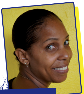
Millicent Janga Schatborgh College