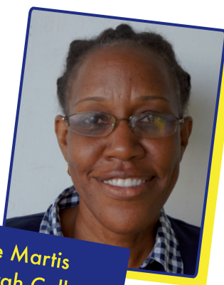
Claudine Martis Schatborgh College

Voordat je met de leerlingen aan dit project begint, moet je zorgen dat alle benodigde materialen aanwezig zijn. Test ook de apparatuur vooraf, zodat dit niet voor problemen zorgt.